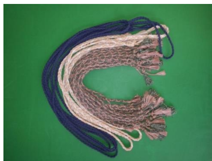
веревки, «косички» и т.п.