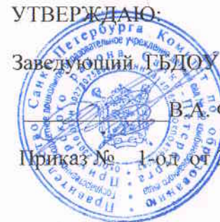
ГРАФИК ПИТАНИЯ на 2024 - 2025 учебный год