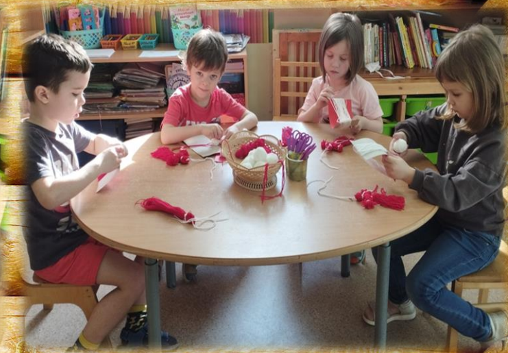
Мартиничка – русский оберег и символ весны