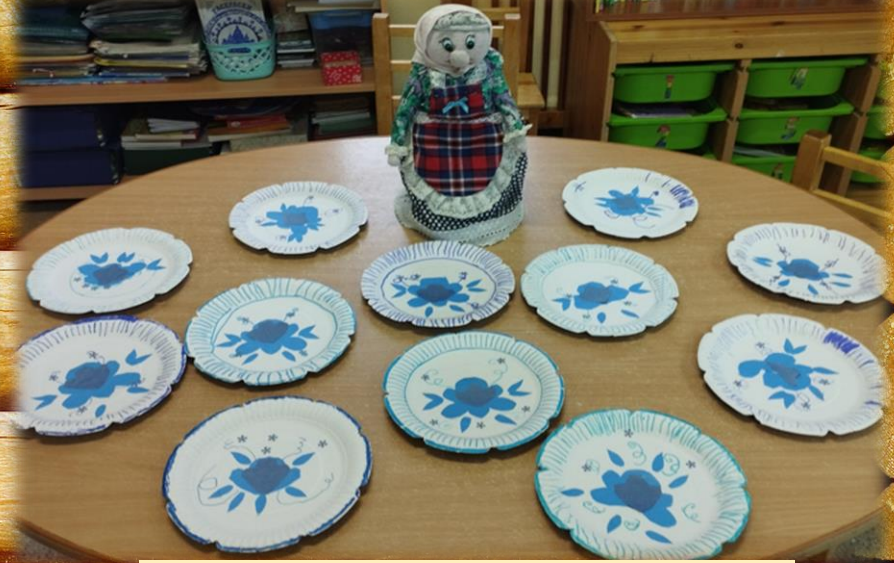
«Тарелка для Федоры Егоровны»