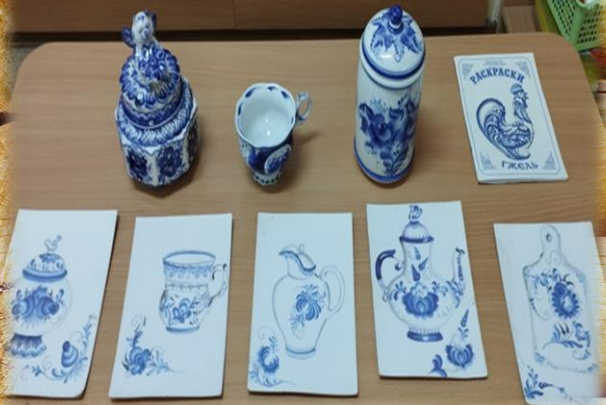
«Гжельский узор на предметах посуды»