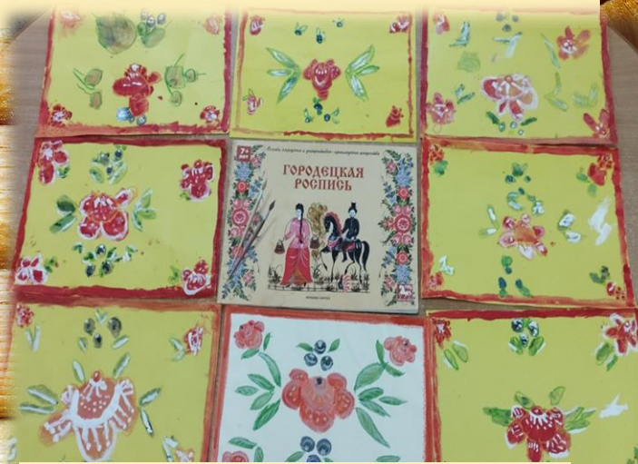
«Городецкий узор на столешнице»