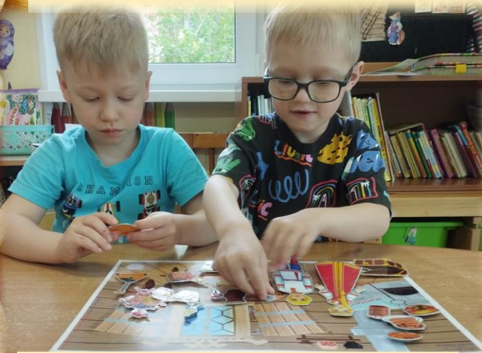
Д/и «Предметы народного быта»