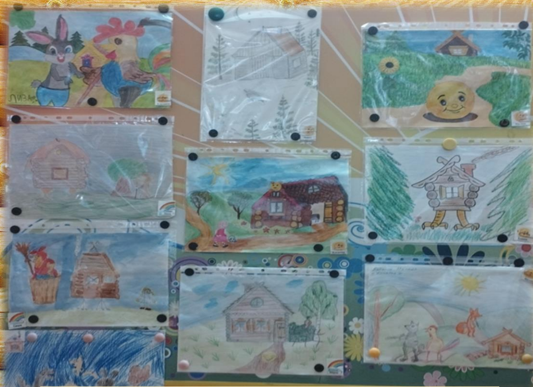
Выставка совместного творчества детей и родителей